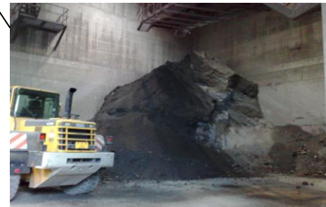
Asche - Schlake