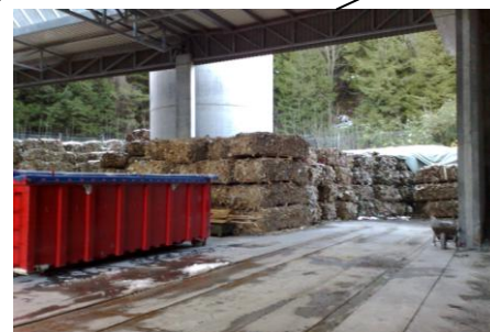
Hier wog die Klasse 1020 kg