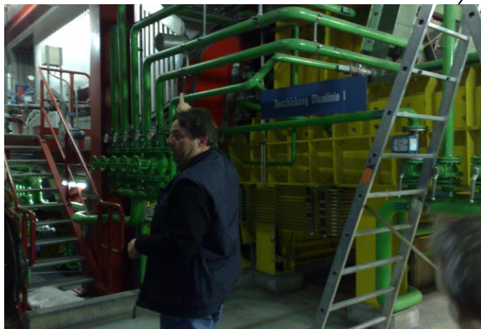
Ofenlinie 1 - Erbaut 1973