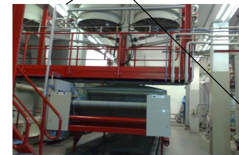
Ölkühler - Waschanlage