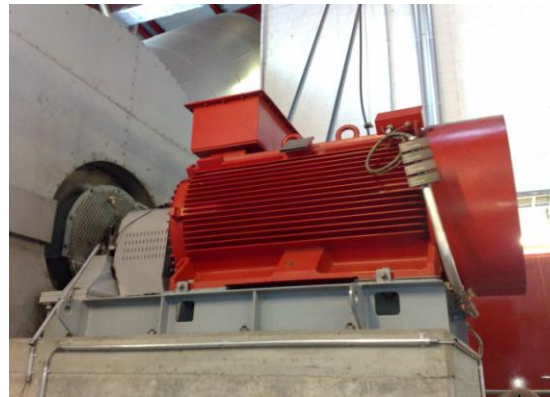
Rauchabzugsgebläse, Motor = 1000 PS