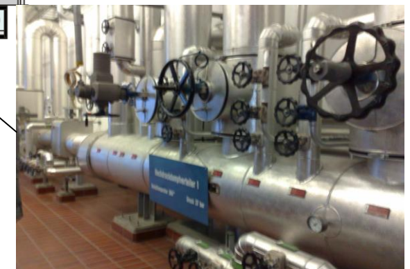
Hochdruckdampfverteiler, 37 bar