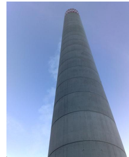
Kamin 100m hoch, Abgas 130°C