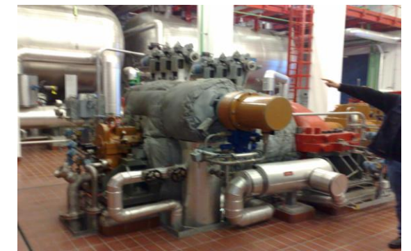
Turbinen - Generatoren