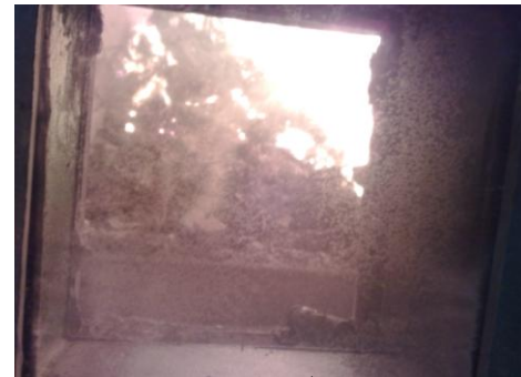
Ofen, 900 - 1000°C